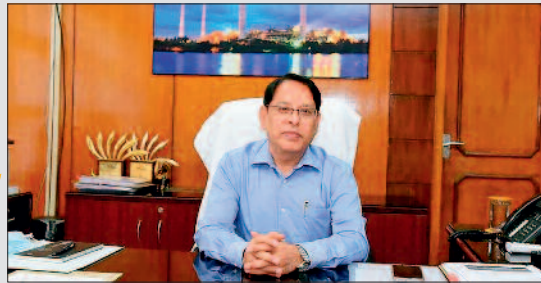
■ मंत्रालय में अधिकारियों से मिले, रखा अपना पक्ष